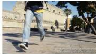
La corsa - Orientamento